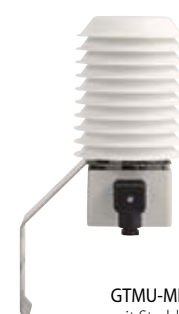
GTMU-MP-SHUT mit Strahlungshut