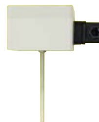
GTMU-MP-AP4 Kanalfühler Standardausführung: FL = 100 mm, D = 6 mm