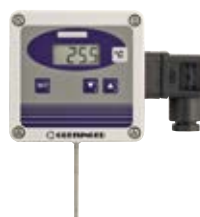
GTMU-MP-AP3 Raum- oder Außenfühler für direkte Wandmontage Standardausführung: FL = 50 mm, D = 3 mm