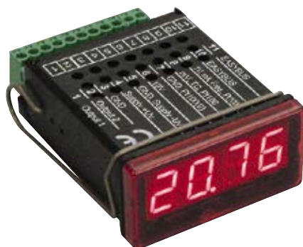
Optional: Frontblende mit Bedientaster (Frontblende ohne Bedientaster im Lieferumfang)