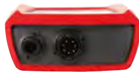
GMH 5130 / 50